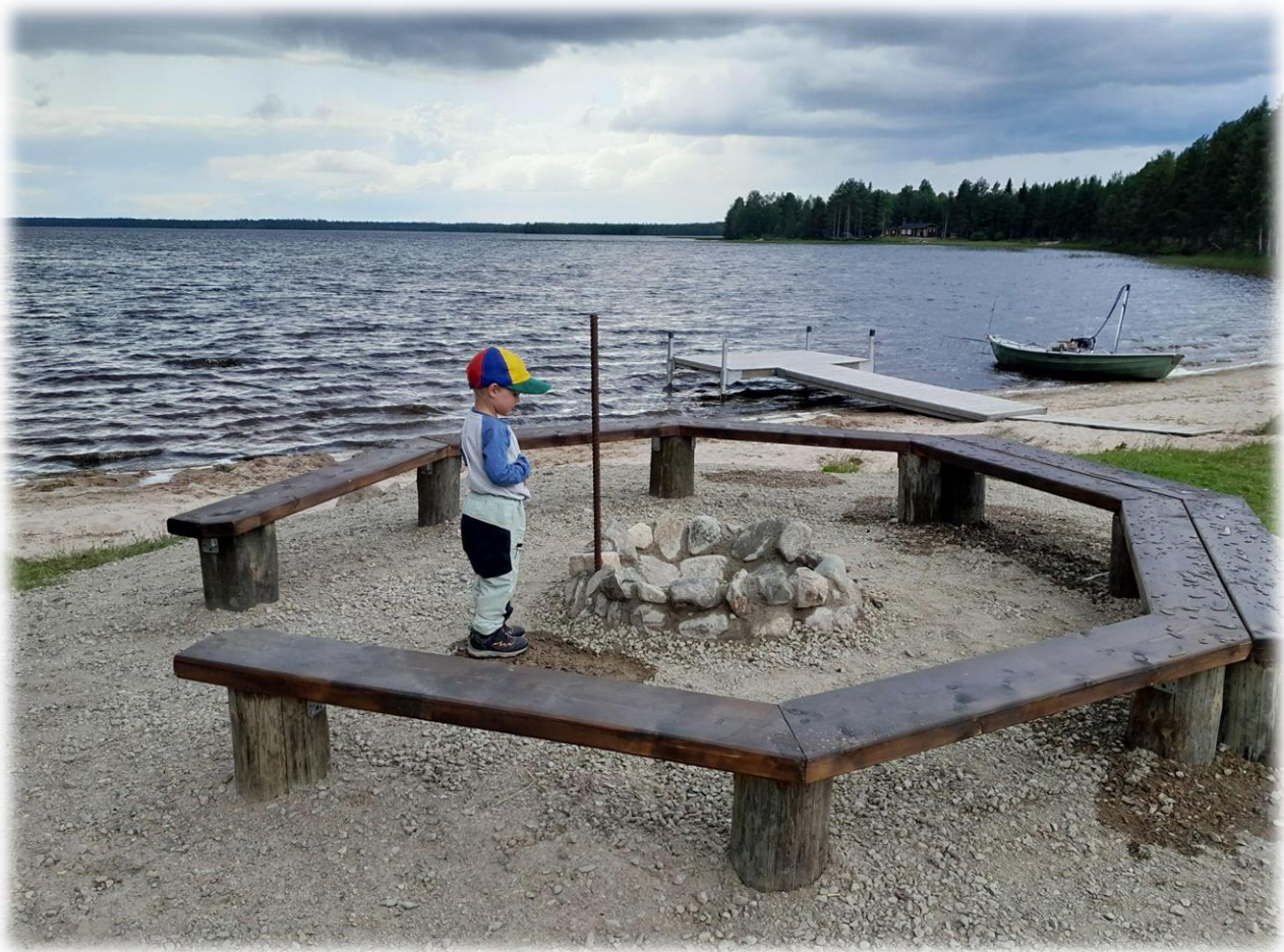
Hiekkaranta kunnostustoimien jälkeen kesällä 2023

Vuoden 2024 toimintasuunnitelman mukaan vuosittaista toimintaa on: