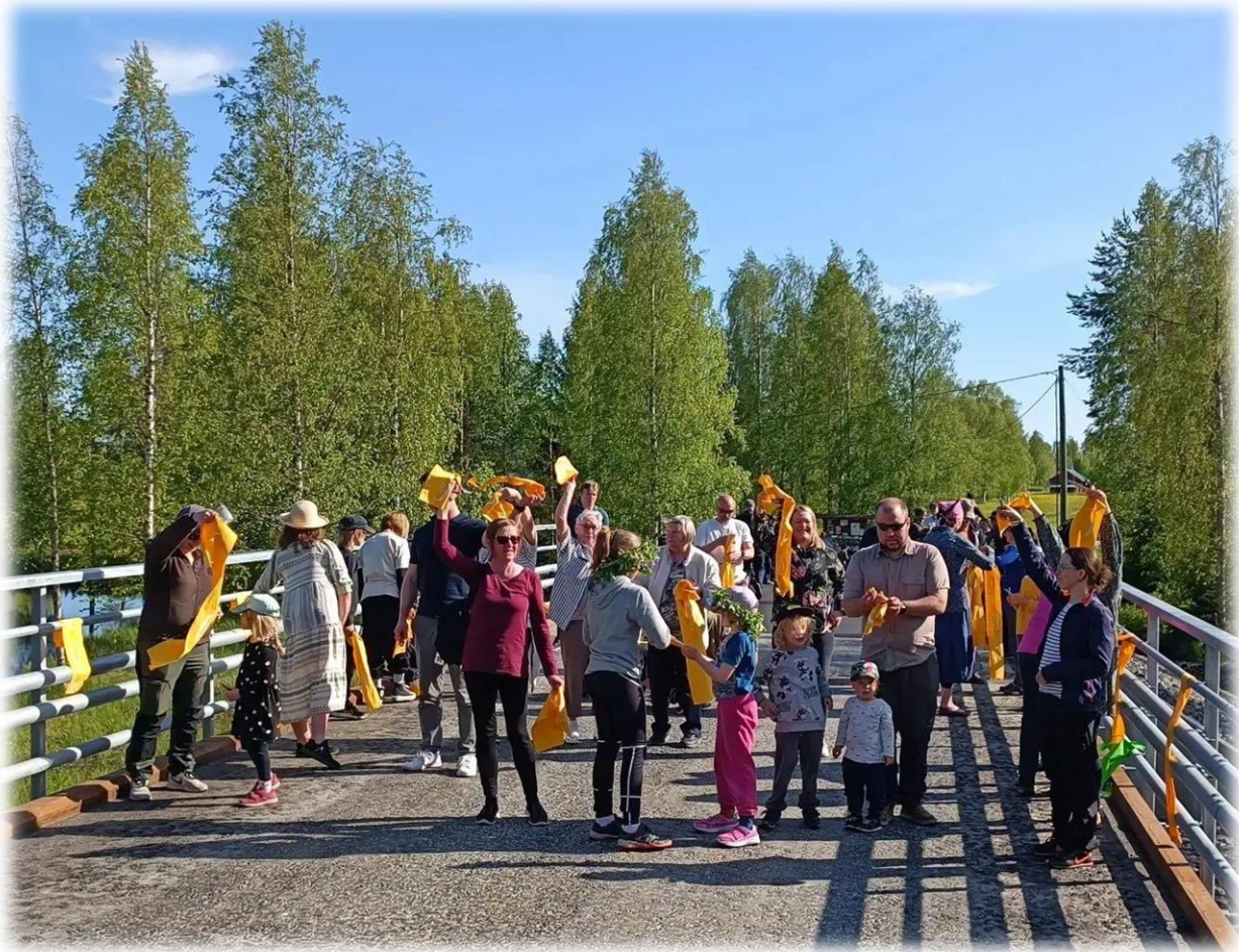
Panumantien uuden sillan avajaiset kesällä 2023

Panuma on vireä ja elävä kylä Panumajärven rannalla. Sijainti on noin 35 kilometrin päässä kaupungin ydinkeskustasta Kurenalta lounaaseen. Oulusta on matkaa noin 60 kilometriä. Kylässämme on parisenkymmentä vakituista asuntoa ja viitisenkymmentä vapaa-ajan asuntoa. Kylämme ikärakenne on nuori keski-iän ollen hieman yli 30 vuotta.